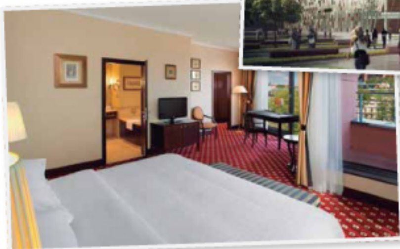
— © Sheraton Krakow Hotel, Suite presidencial Sheraton Krakow Hotel

Es una de las ciudades más grandes, antiguas e importantes de Polonia. Capital de województwo Małopolskie , lo que traduciríamos como Pequeña Polonia . Cracovia ya es una marca, y una de las