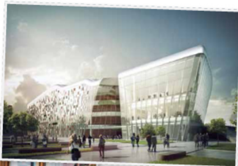
— ICE Krakow (Gingarden & Ewój — Architects, Kraków in cooperation with Anata (Szabo & Associates, Tokyo) visualization/S: Monokolor — Krzysztof Brodzka

Cracovia se caracteriza por la variada oferta en restaurantes. La mayoría concentrados alrededor