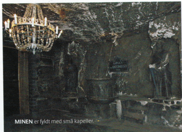
MINEN er fyldt med små kapeller.

I det hele taget ligger der en gigantisk arbejdsindsats bag den stadig aktive mine, hvor den traditionelle udvinding af salt dog er ændret til mere moderne metoder, som primært udføres ved hjælp af vand og efterfølgende tørring på jordoverfladen. Her er blevet slidt og slæbt i mere end 700 år, og faktisk har