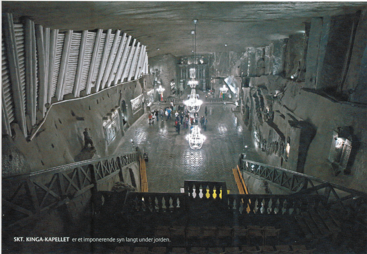
SKT. KINGA-KAPELLET er et imponerende syn langt under jorden.

minen været en stor økonomisk gevinst for ikke bare området omkring Krakow, men også hele Polen. Salt har til tider nærmest været sin vægt værd i guld, og vores kyndige guide lægger ikke skjul på, at høsten fra de dybe gange har været kilde til stor rigdom.