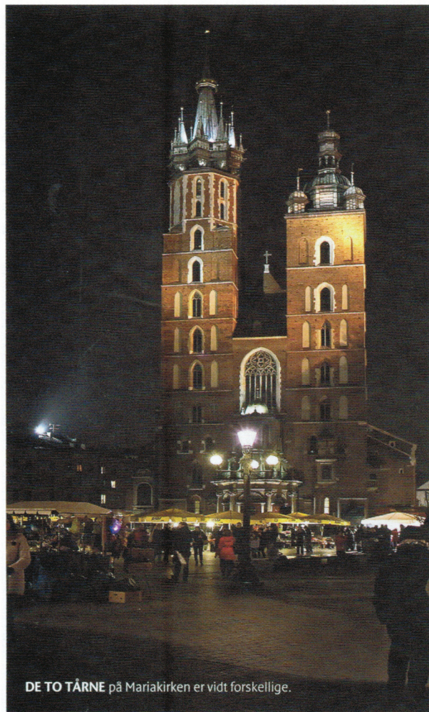
DE TO TÅRNE på Mariakirken er vidt forskellige.