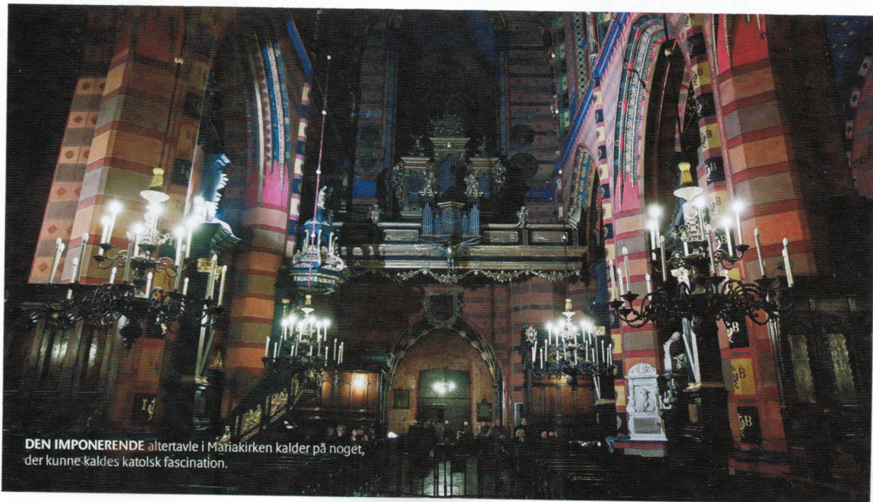
DEN IMPONERENDE altertavle i Mariakirken kalder på noget, der kunne kaldes katolsk fascination.

Det gælder også på Wawel-slottet, som troner på højedraget i den ene ende af den gamle bydel. Med sin dominerende renaissance-plads og domkirken drager det gamle kongeslot på uundgåelig vis, og udsigten over byen og floden er noget nær