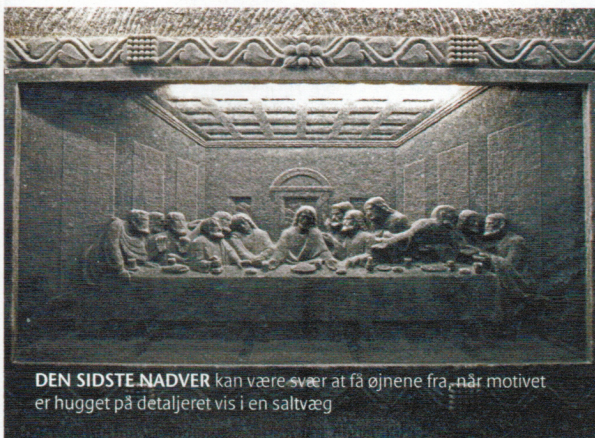
DEN SIDSTE NADVER kan være svært at få øjnene fra, når motivet er hugget på detaljeret vis i en saltvæg

Det behøver vi nu ikke bekymre os om i dag, hvor vi følger turistruten på 2,5 kilometer rundt i minen. Når først de godt 300 trappetrin er forceret, kan vi således ubesværet prome-