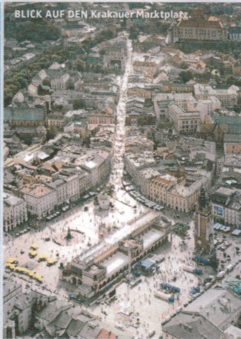
BLICK AUF DEN Krakauer Marktplatz.